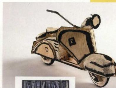
Javier Mariscal Vespa. Small wood carving on metal base. The famous designer Javier Mariscal participated with his Vespa at the Drap-Art show in Barcelona in 2014 and Pittsburgh 2016.