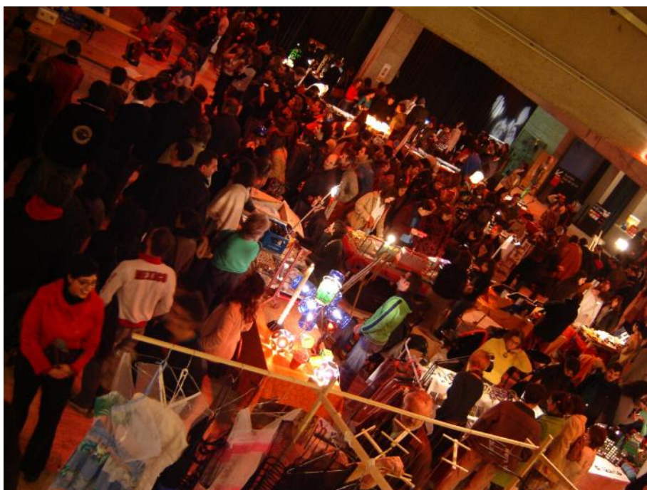
Vista general del Mercat