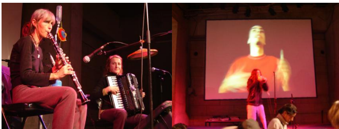
Pole Pole i Diego Ain

El dissabte, a més a més al Hall actuà el grup Pole Pole, que amb la seva fanfàrria experimental (que inclou instruments insòlits com una màquina d'escriure o el so d'una aspirina efervescent en directe), va sorprendre i entusiasmar el públic que quedava a la sala, que tot seguit, pujà cap al C3BAR on el grup L.U.V.E. va donar el toc final.