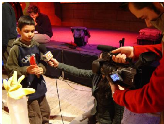
Nen dona entrevista per la televisió