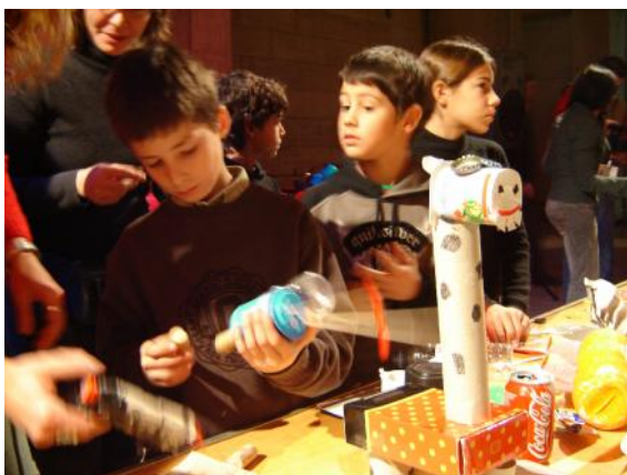
Taller participatiu per a nens i nenes