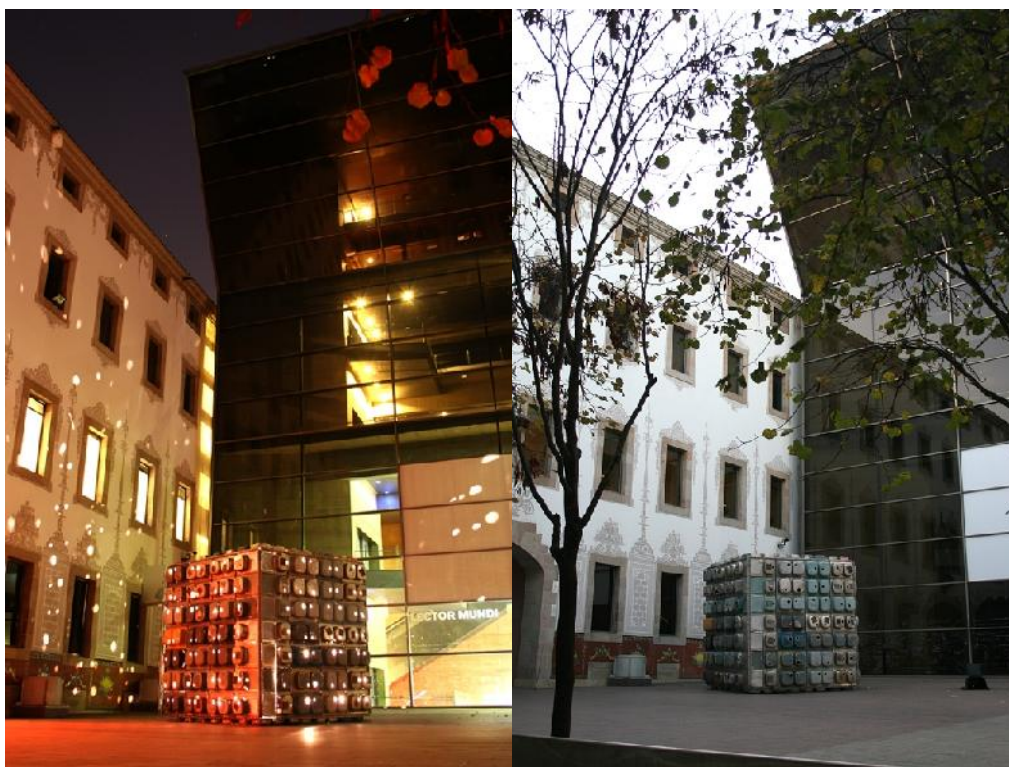
Trashforma'04. Cub de 3,5m x 3,5m de 240 piques de cuina d'acer inoxidable

Trashforma'04, la instal·lació artística del col·lectiu d'artistes valencians Trashformaciones, estrenada al Fib'04, l'apartat artístic del Festival de Benicassim, on va ser tot un èxit. Es tracta d'un cub de 3,5m x 3,5m realitzat amb 240 piques de cuina d'acer inoxidable. Es va situar al Pati de les Dones, on va atraure l'atenció de tots els vianants i de la premsa.